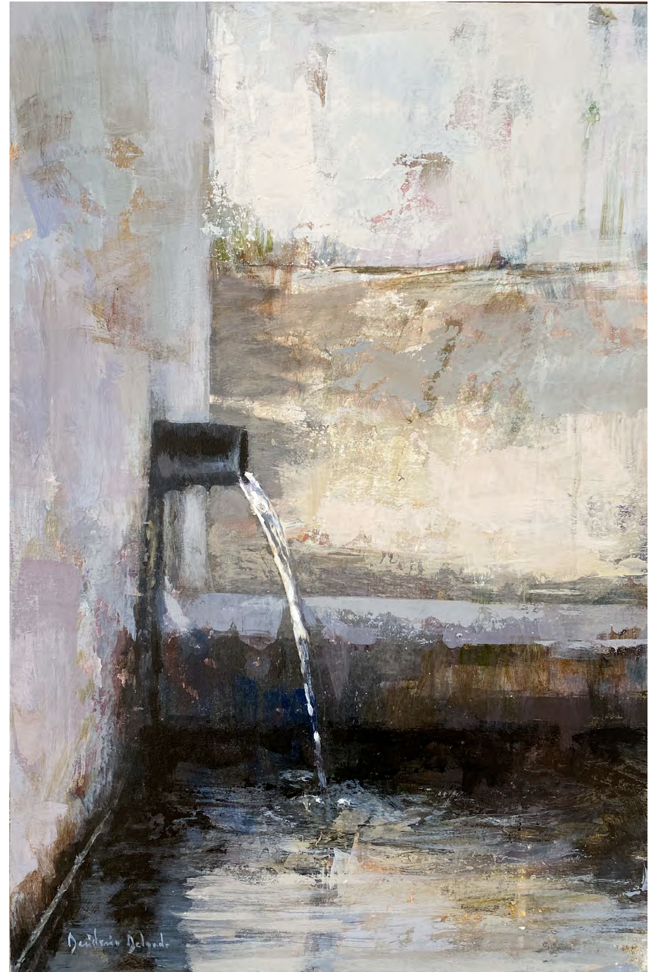
Serie pilones V. Acrílico sobre tabla 60 x 40 cms.