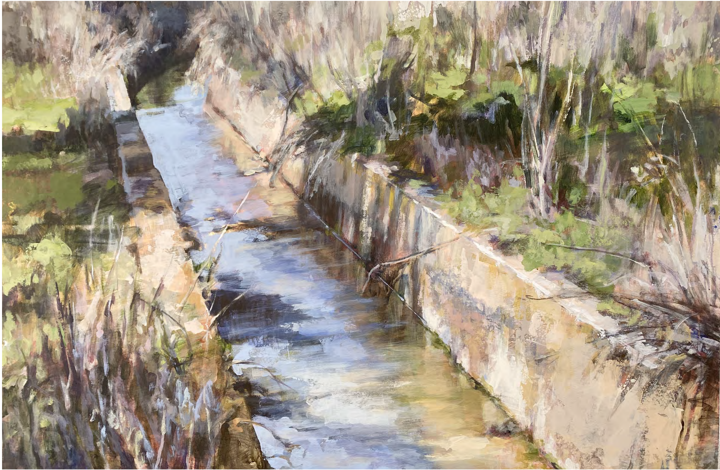
Serie acequias V. Acrílico sobre tabla 100 x 150 cms.