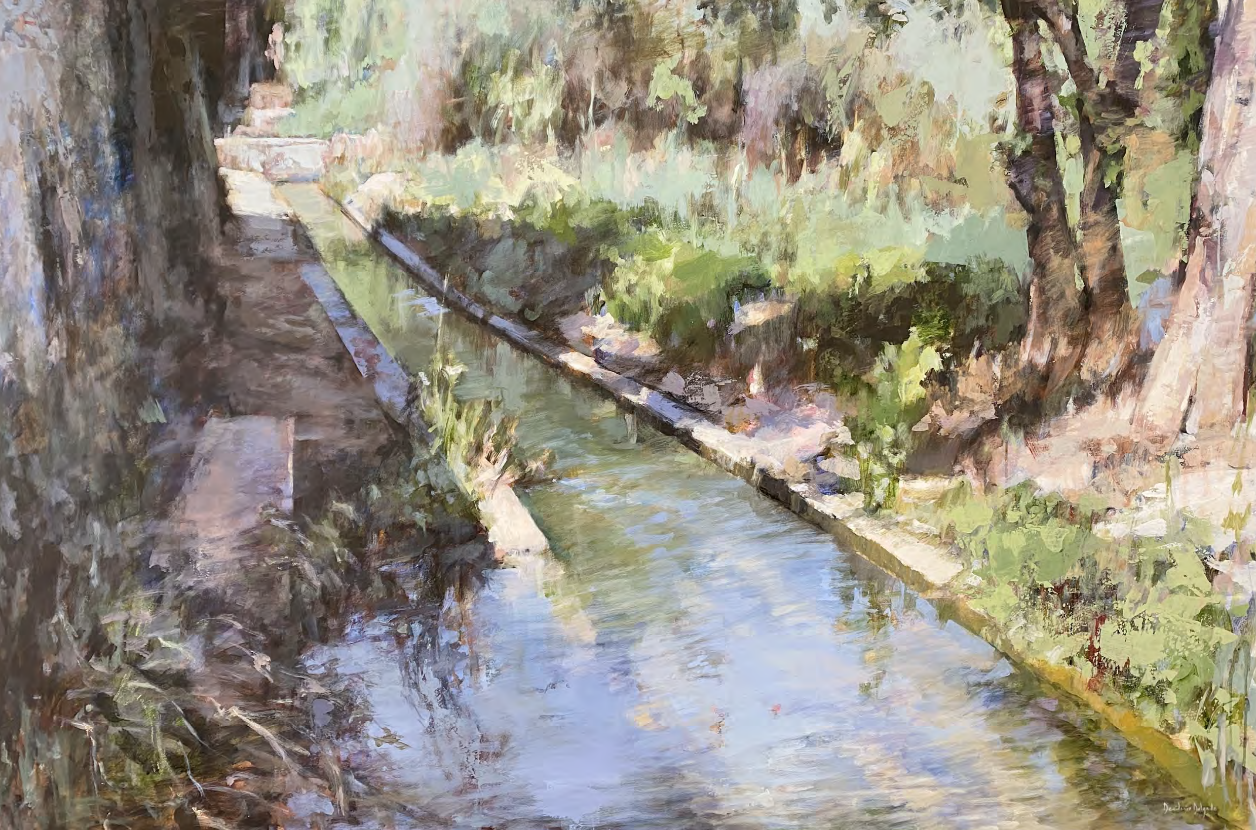
Serie acequias I. Acrílico sobre tabla 122 x 180 cms.

“...Río arriba voy buscando fuente donde descansar...”