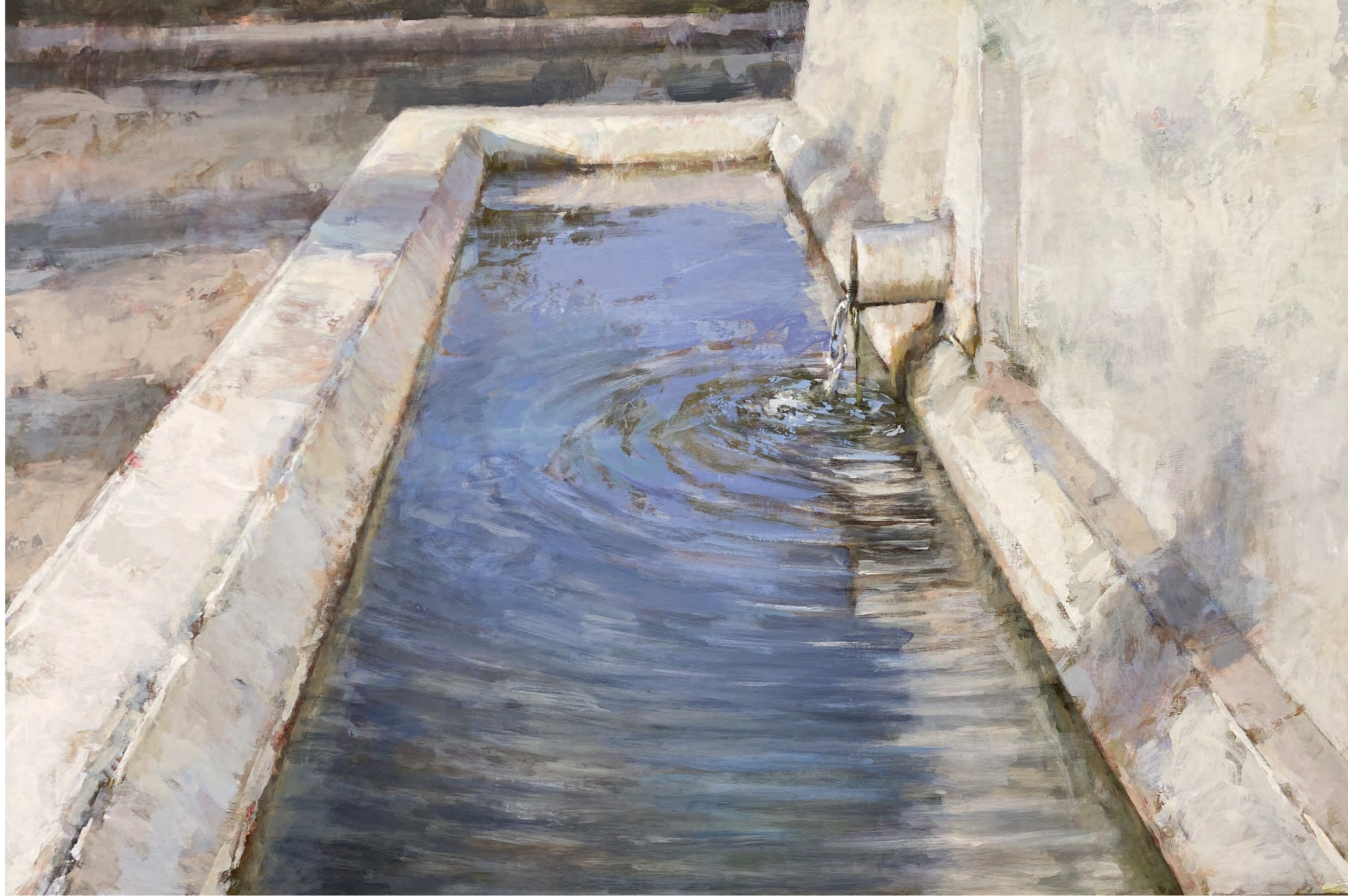
Serie Pilonos VII. Acrílico sobre tabla 100 x 150 cm.