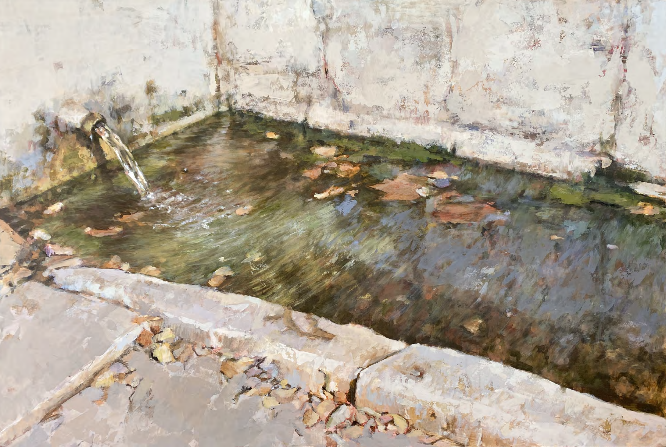
Serie Pilonos VIII. Acrílico sobre tabla 122 x 180 cms.

“Fuente verdinosa donde el agua sueña, donde el agua muda resbala en la piedra”.