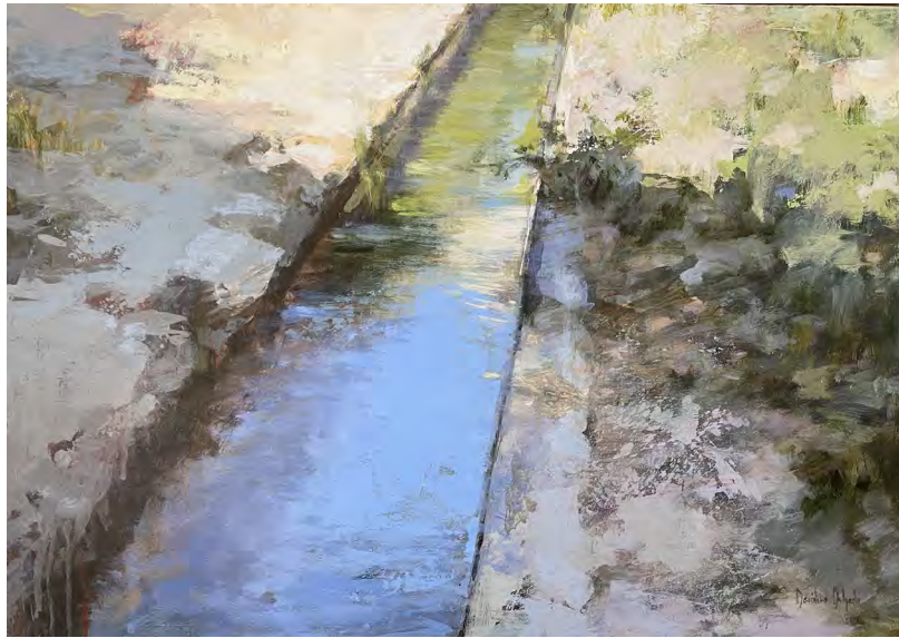
Serie acequias IV. Acrílico sobre tabla 50 x 70 cms.