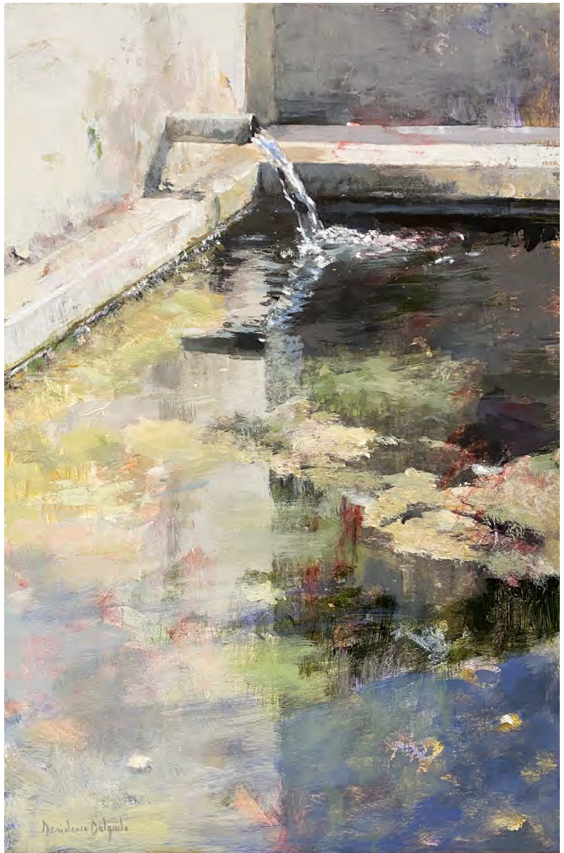
Serie pilones IV. Acrílico sobre tabla 60 x 40 cms.