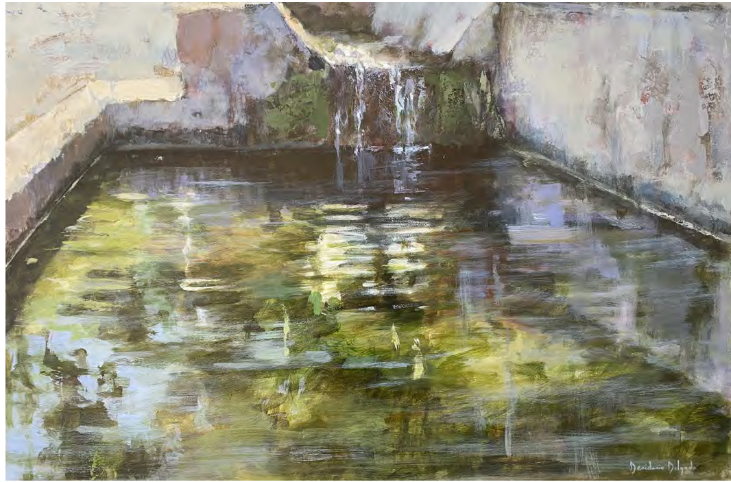
Serie pilones II. Acrílico sobre tabla 70 x 90 cms.