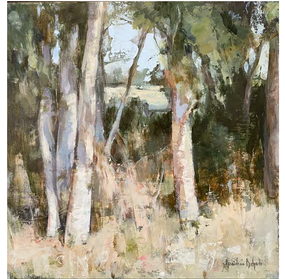
Serie arboleda I. Acrílico sobre tabla 40 x 40 cms.