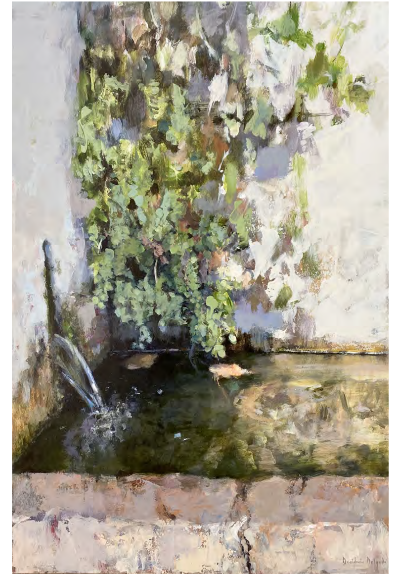
Serie pilones I. Acrílico sobre tabla 90 x 70 cms.