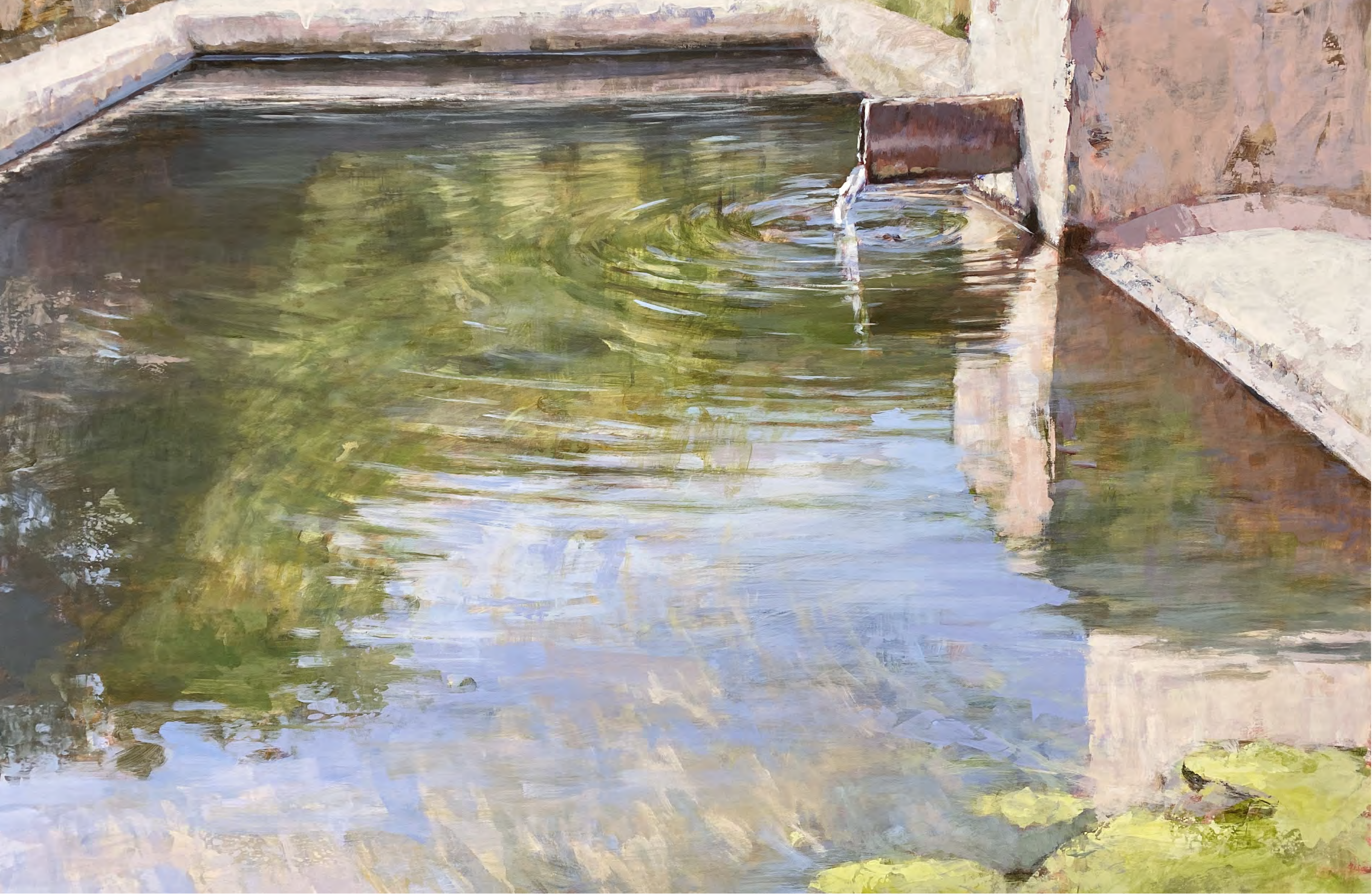
Serie pilones III. Acrílico sobre tabla 100 x 150 cms.